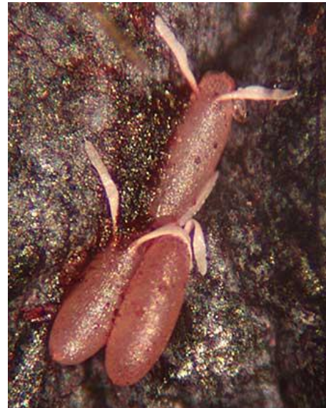
Fig.4. Huevecillos de D. suzukii .