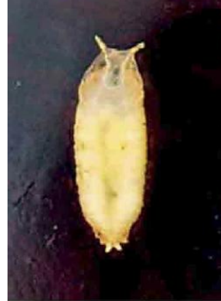
Fig. 2. Pupa de Drosophila suzukii en el interior de una cereza.