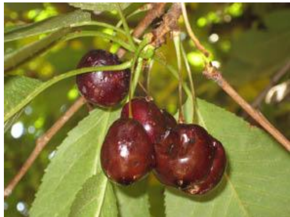
Fig. 7. Cerezas dañadas por D. suzukii .