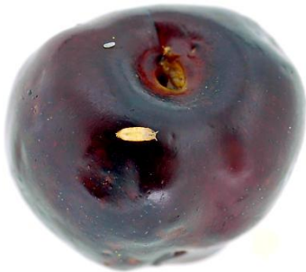
Fig. 6. Pupación de D. suzukii sobre cereza. (Fuente: University of California Cooperative Extension).