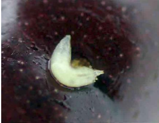
Fig.1. Larva de Drosophila suzukii en el interior de una cereza.