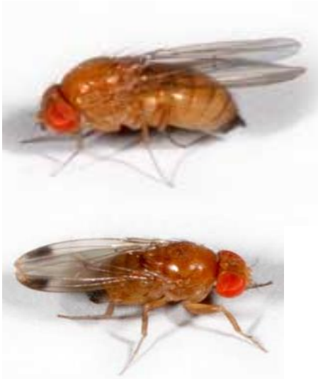
Fig. 3. Adultos de Drosophila suzukii . La hembra a diferencia del macho no presenta manchas en la parte posterior de las alas.