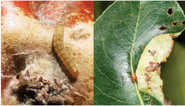
Fig. 1. Daño en fruto y «enrollamiento» de hoja.