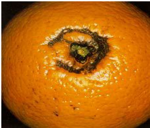
Fig. 6. «Halo», causado por la plaga.