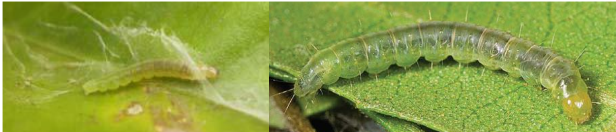
Fig. 5. Larva madura en hoja de cítrico (der.) Créditos: Mo 2006; Izquierda Créditos: Jack Kely Clark 2008.