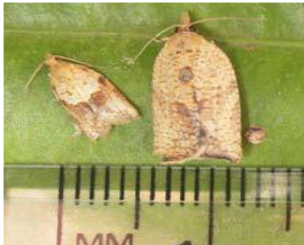
Fig. 7. Adultos, macho (izq.) y hembra (der.). Créditos: Mo, 2006.