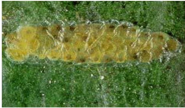
Fig. 2. Huevecillos. Créditos: Mo 2006.