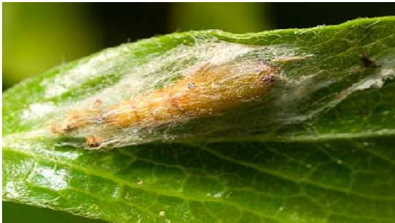
Fig. 3. Refugio de seda en el envés de la hoja.