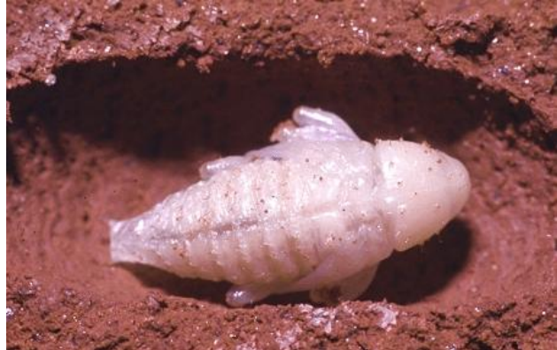
Fig. 2. Pupa de C. caryae .