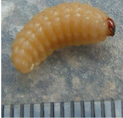
Fig. 1. Larva de C. caryae .