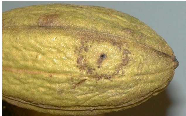
Fig. 4. Halo y orificio, daños por oviposición de C. caryae en nuez.