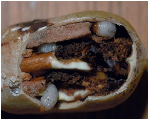
Fig. 3. Larvas de C. caryae alimentándose.