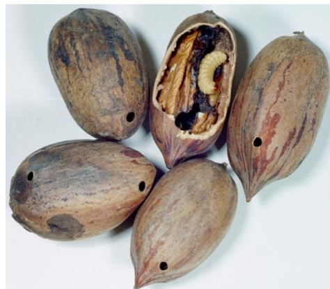
Fig. 6. Daños externos y larva alimentándose de nuez pecanera.