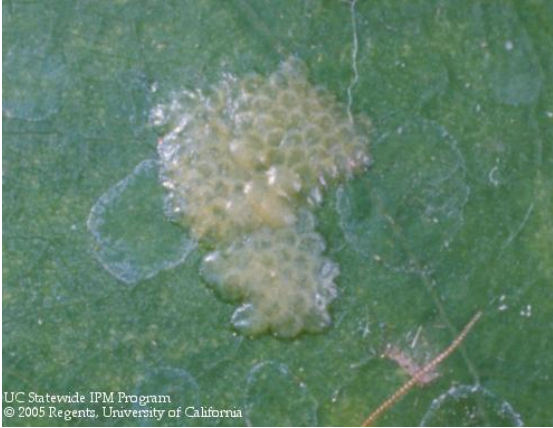
Fig. 1. Masa de huevecillos superpuestos