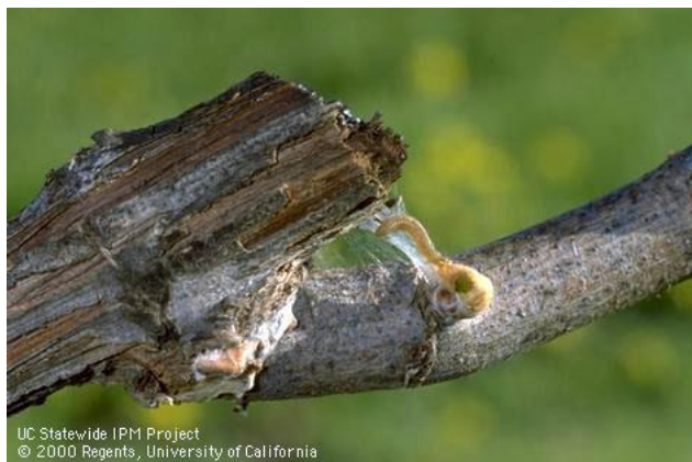
Fig. 7 Larva de A. franciscana alimentándose de brotes tiernos.