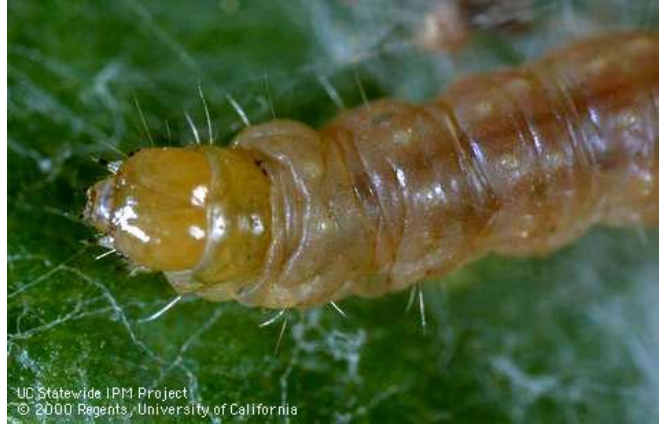
Fig. 2. Larva A. franciscana del último instar.