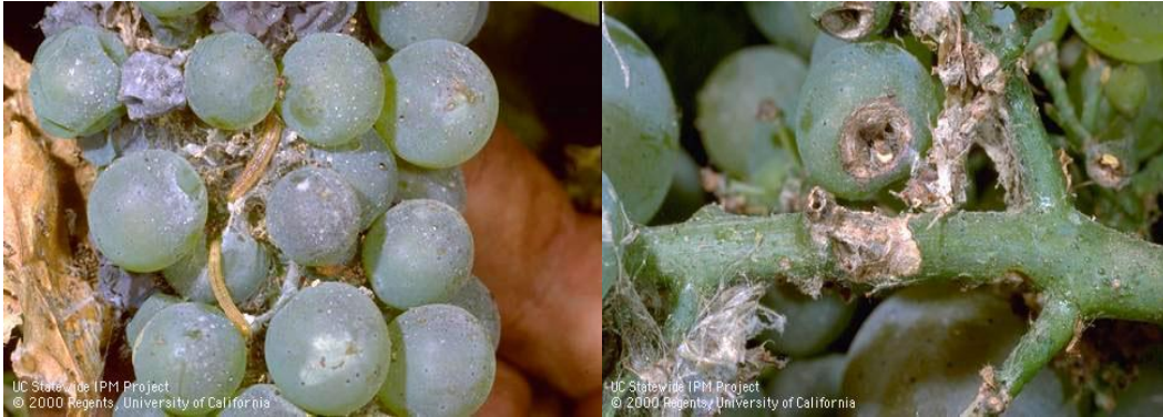
Fig. 5. Daños ocasionados por larvas de A. franciscana en racimos de vid .