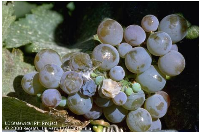
Fig.6. Daños y redes fibrosas en frutos de vid ocasionados por larvas de A. franciscana .