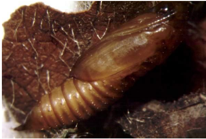
Fig. 3. Pupa de A. citrana .