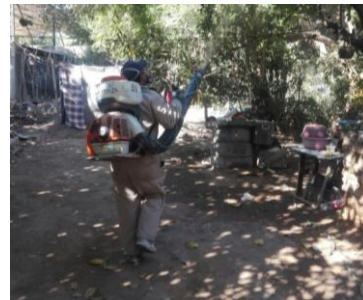
Control de focos de infestación del psíldos en zonas urbanas por brigadas de los OASV.