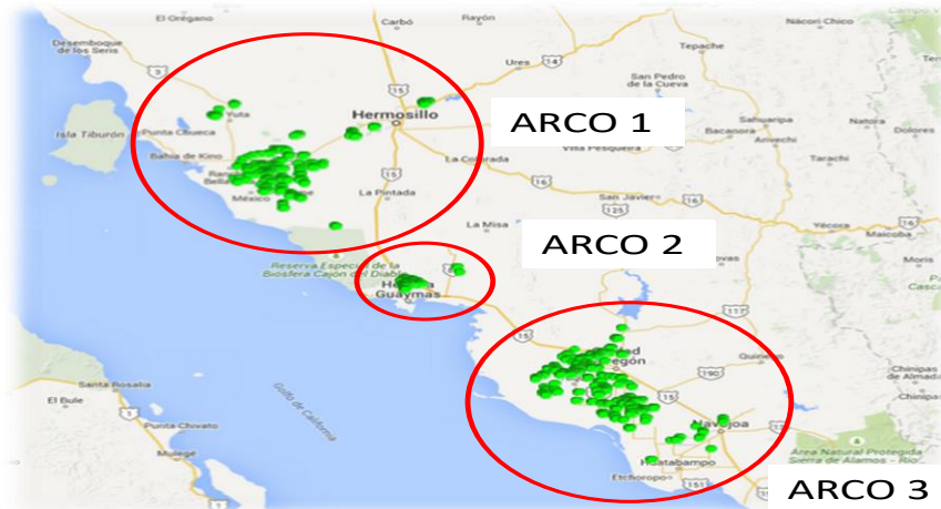
Ubicación de las tres Áreas Regionales de Control o ARCOs en Sonora.

SENASICA SERVICIO NACIONAL DE SANIDAD, INOCUIDAD Y CALIDAD AGROALIMENTARIA