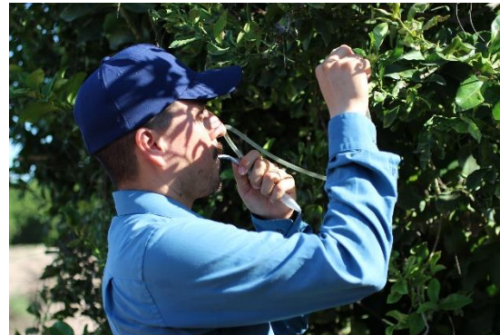
Colecta de adultos de psíldos para su envío y diagnósticos de HLB.

Control químico. Con la finalidad de reducir la diseminación del HLB, se estableció un esquema de manejo regional del psílido asiático de los cítricos, a través de tres Áreas Regionales de Control (ARCOs) 1 , para el caso Sonora se tienen establecidos dos periodos de control regional en el total de huertos ubicados en las tres ARCO's la cual es realizada con recursos del productor (febrero y septiembre), posterior el control se realiza en focos localizados, además brigadas de los OASV, realizan el control en la zona urbana, buscando el impacto en los niveles poblacionales del insecto vector.